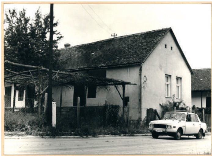
A szárászi klubkönyvtár épülete (1977)

régiben megvásárolt Trabantokat, egy jégeső pusztítását, de az óvodai csendespihenő pillanatait is.