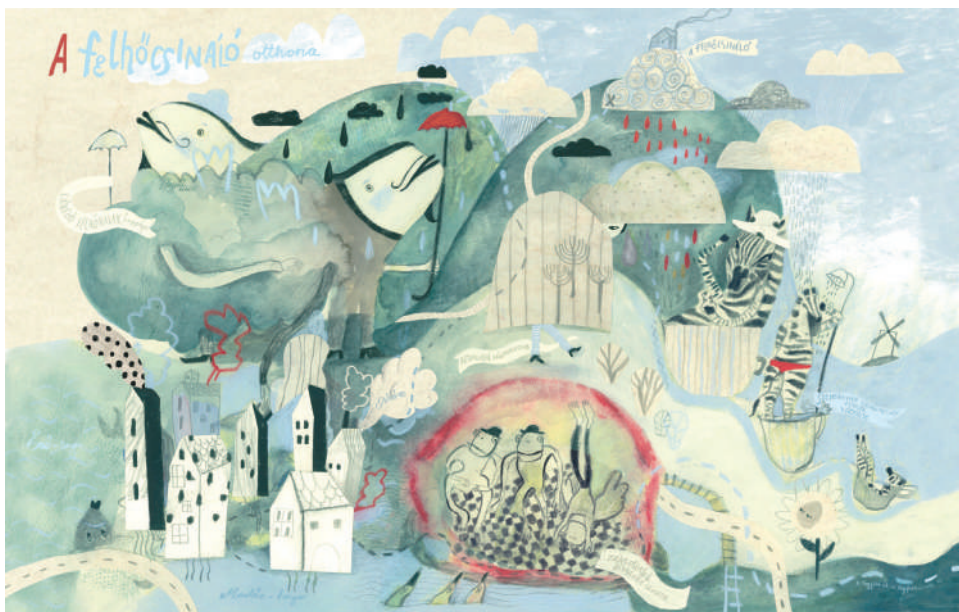
Térkép bárhova című böngészőből egy részlet