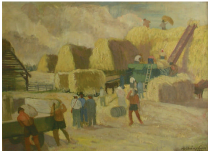
Virányi Endre - Cséplés (1961, olaj-vászon)

Az Új istálló néhány évvel később szerepelt Simon gyűjteményes kiállításán Kaposvárott. A műértő kritikus itt nem annyira a kép társadalmi tartalmát, inkább a kiváló művészi megvalósítást, a festmény egyedi színvilágát emelte ki: a kép „a nyári reggel hangulatát árasztja, a meleg még csak rózsaszín, de érezni, hogy nemsokára itt is narancssárga hőség lesz” .